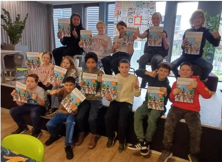
Alle leerlingen uit groep 7 zijn geslaagd voor het theoretische verkeersexamen. Gefeliciteerd kanjers!

TWEEWEEKLIJKSE NIEUWSBRIEF VAN IKC DOMMELEN: OPENBARE BASISCHOOL DE BELHAMEL, HET FACET EN KINDEROPVANGORGANISATIE IK-OOK I.S.M. HAAR OUDERVERENIGING EN MEDEZEGGENSCHAPSRAAD