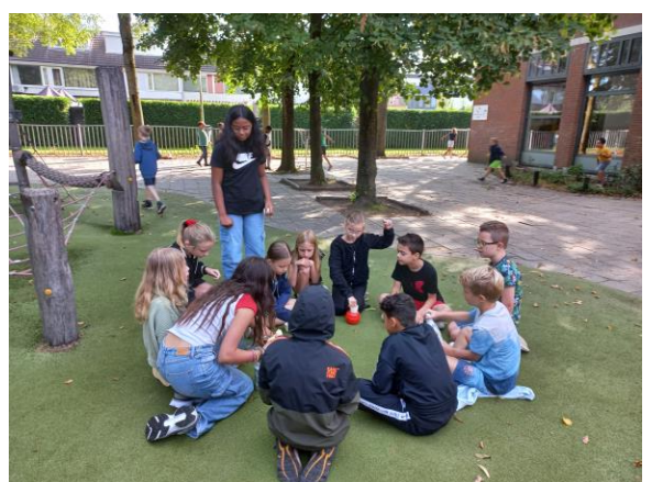
Weerwolven in de pauze