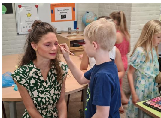
De make-up challenge