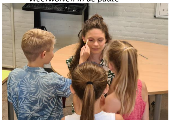
De make-up challenge