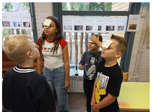
Welke opdracht heb ik op mijn hoofd?