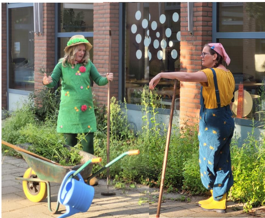
De rollen zijn duidelijk verdeeld ....