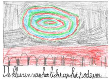
De kleuren van het licht op het podium